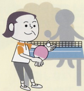
各種スポーツなど