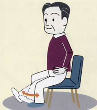
関節の曲げ伸ばし